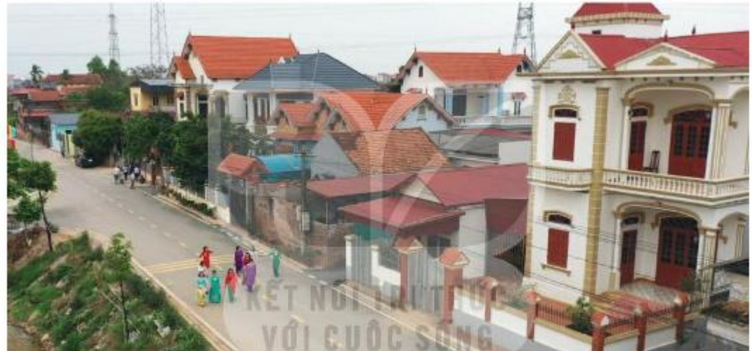
▲ Hình 6. Nhà ở vùng Đồng bằng Bắc Bộ hiện nay