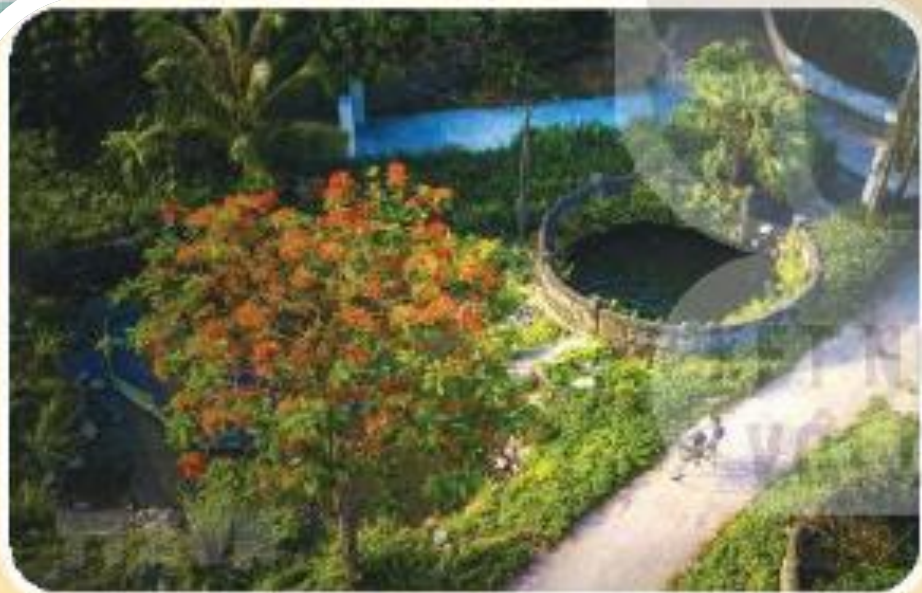
▲ Hình 3. Giếng nước ở Hoa Lư (tỉnh Ninh Bình)