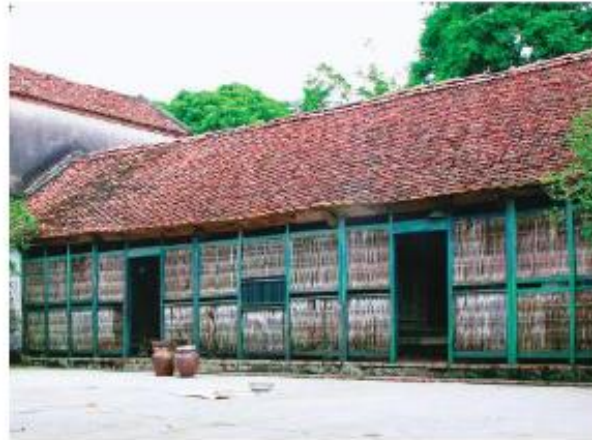
▲ Hình 5. Nhà ở truyền thống vùng Đồng bằng Bắc Bộ

Ngày nay, nhà ở của người dân có sự thay đổi theo hướng hiện đại và tiện nghi hơn.