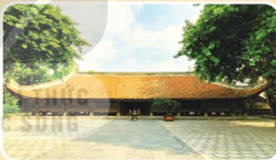
▲ Hình 4. Đình làng Đình Bảng (tỉnh Bắc Ninh)

Giếng làng trước đây là nơi cung cấp nguồn nước sinh hoạt chính cho dân làng.