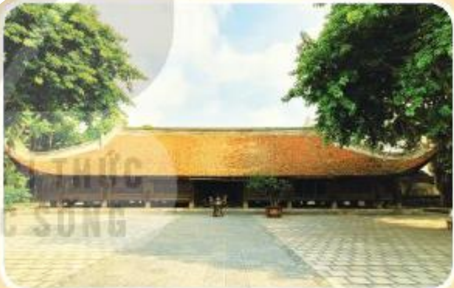
▲ Hình 4. Đình làng Đình Bảng (tỉnh Bắc Ninh)