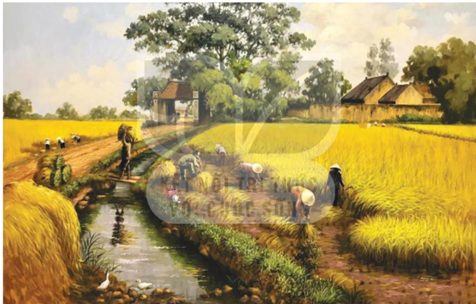
▲ Hình 1. Một cảnh làng quê truyền thống vùng Đồng bằng Bắc Bộ (tranh vẽ của họa sĩ Trần Nguyên)