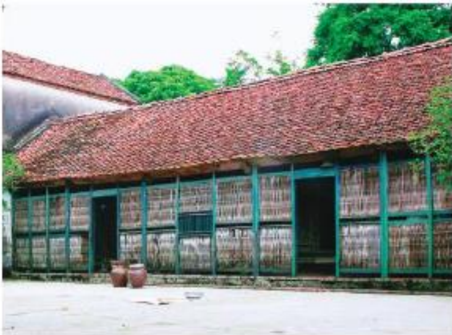
▲ Hình 5. Nhà ở truyền thống vùng Đồng bằng Bắc Bộ