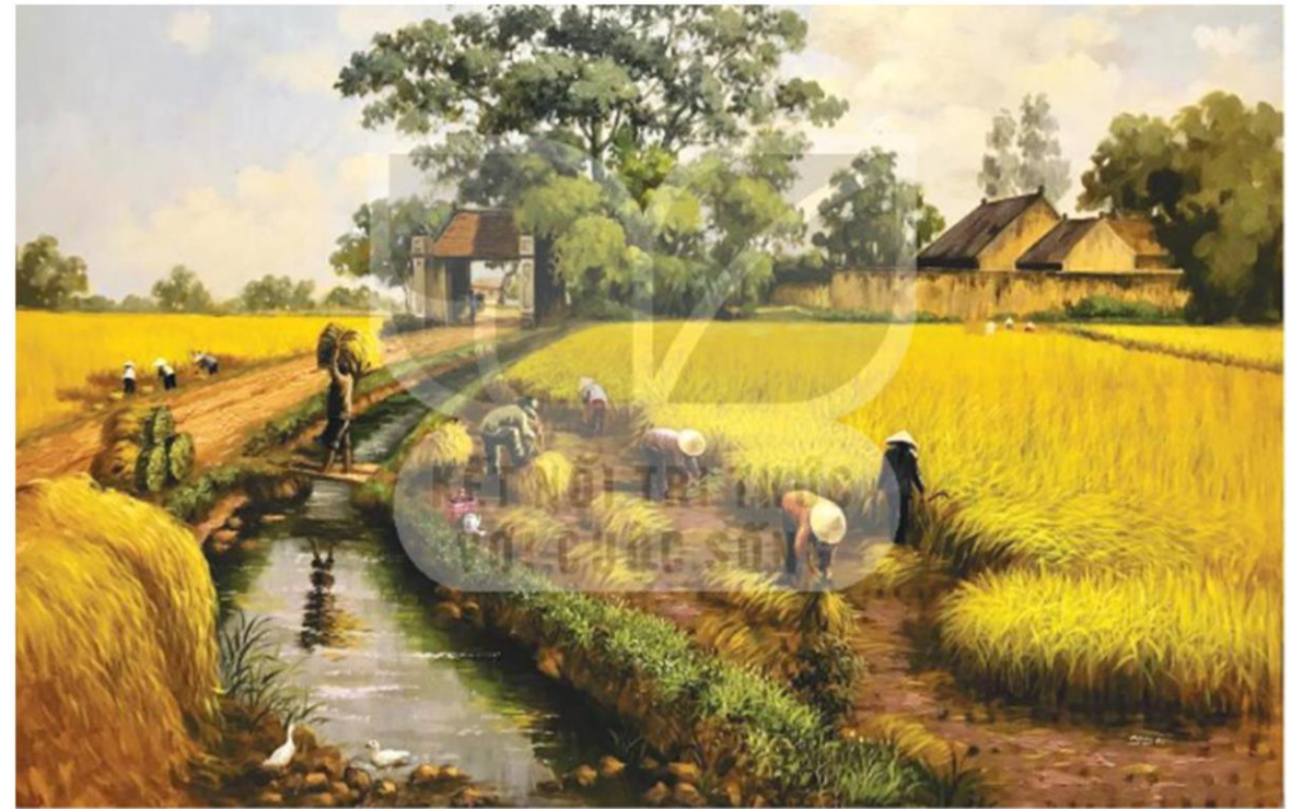
▲ Hình 1. Một cảnh làng quê truyền thống vùng Đóna bằna Bắc Bô (tranh vẽ của họa sĩ Trần Nauvên)