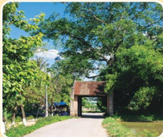
▲ Hình 2. Cổng làng Đường Lâm (thành phố Hà Nội)

Cây đa tạo bóng mát thường được trồng ở đầu làng, cuối làng hoặc ở vị trí trung tâm, bên cạnh các di tích lịch sử – văn hoá.