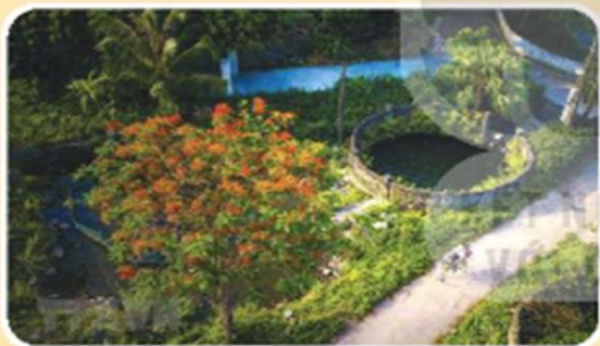
▲ Hình 3. Giếng nước ở Hoa Lư (tỉnh Ninh Bình)

Giếng làng trước đây là nơi cung cấp nguồn nước sinh hoạt chính cho dân làng.